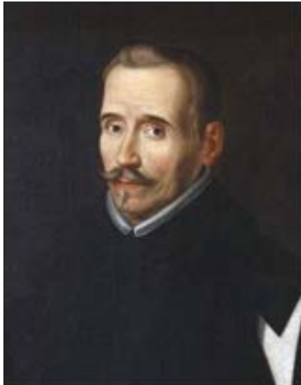
Foto: Retrato de Lope de Vega, atribuido a Eugenio Caxés, Museo Lázaro Galdiano (1630 aprox.), Madrid, España.

En el fragmento de La Circe de Lope de Vega que se presenta a continuación, se observa la ambigüedad y lucha en la integralidad, como si fueran dos componentes opuestos de la estructura, si estructuralmente hablando son complementarios. Por tanto se observa entre líneas, el intento de dividir, que si ese intento se transforma en hecho, estaríamos ante el caso de la ausencia de la integralidad, transfiriendo estas ideas de Lope de Vega a una relación conyugal. Al mismo tiempo se reconoce que hay partes en el sujeto y la lucha que puede sostenerse entre estas partes cuando se da la carencia de armonía, coherencia e integralidad entre ellas.