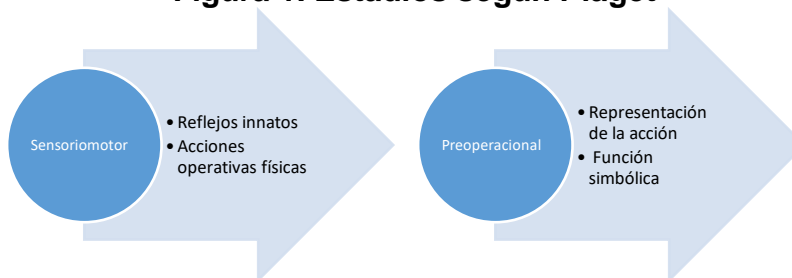
Figura 1. Estadios según Piaget